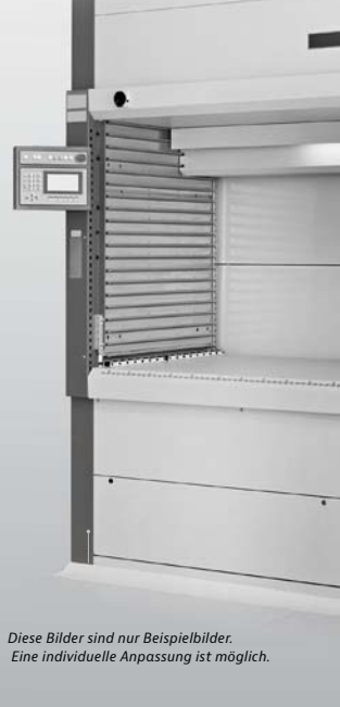
Diese Bilder sind nur Beispielbilder. Eine individuelle Anpassung ist möglich.

Auch unser Schließfachsystem garantiert eine sichere Einzelentnahme, da es ebenfalls über den StoreManager PRO oder eine eigene Steuereinheit verwaltet werden kann. Verschiedene Fachgrößen, die sich ebenfalls frei nach Ihren Bedürfnissen konfigurieren lassen, ermöglichen die sichere Einlagerung von sperrigen Gütern. Optional ist eine Stromversorgung in den Einzelfächern möglich, um beispielsweise Ihre Elektronikgeräte stets einsatzbereit zu halten.